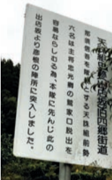
東吉野村には天誅組の史跡や看板が...

独立後も、フリープロデューサーとして神戸開港150年記念歌の制作、豪州やハワイなど世界12カ国で国際交流イベントも手がけたが、「時間があれば、中山道など旧街道を散策。ロケハンが趣味だった」と映画熱は冷めなかった。